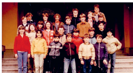
Beispiel eines von vielen Klassenfotos 5. Klasse 1981

Seine erste Stelle bekam er in Berlingen, «aber nach einem halben Jahr – 1969 – holte man mich nach Neuhausen. Ich durfte sogar das Schulhaus auswählen. Ich begann im Rosenberg zu unterrichten, und es war wie heimkommen. Einige ehemalige Lehrer wurden nun zu meinen Kollegen!» Und dort blieb er bis zur Pensionierung 2007.