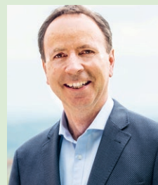
Liebe Neuhauserinnen und Neuhauser

Sie halten heute das erste Exemplar der «Neuhuuser News» in Ihren Händen. Der Gemeinderat hat sich zum Ziel gesetzt, die Bevölkerung besser zu informieren und mehr Mitsprache zu ermöglichen. Mit dieser Ausgabe ist beides möglich: Sie können sich über den Richtplan der Gemeinde informieren und sich dazu äussern. Sie können auch unsere «Neuhuuser News» durchsehen und uns ihre Meinung dazu sagen. Was passt Ihnen, was fehlt noch, wo könnten wir besser werden? Wir sind auf Ihr Feedback angewiesen, nutzen Sie es. Es ist unsere Gemeinde – nur gemeinsam kommen wir weiter! Danke für Ihr Engagement!