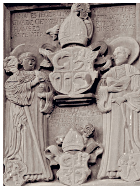
Die steinerne Wappentafel der Äbte Theobaldus und Geroldus von Rheinau zeigt neben etlichen Wappen auch die beiden Schutzheiligen des Klosters, Fintan (rechts) und Benedikt (links).

sich mit ein paar wenigen Parzellen. Ein paar Jahre später verkaufte Hallau seinen Anteil an die Stadt. Zum Aazheimerhof gehören nebst 157 ha Wald auch rund 60 ha Weideland, die heute von den Familien Schwyn und Schüpbach bewirtschaftet werden.