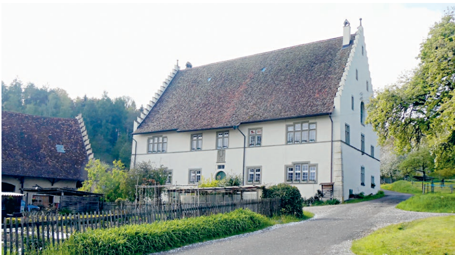
Der Aazheimerhof gehörte bis 1836 dem Kloster Rheinau. Später wurden Gehöft und Umschwung von Neuhausen am Rhf., Hallau und Schaffhausen ersteigert.

Während der Reformationsunruhen bot der Aazheimer Hof immer wieder Unterschlupf für Anhänger der Täu-